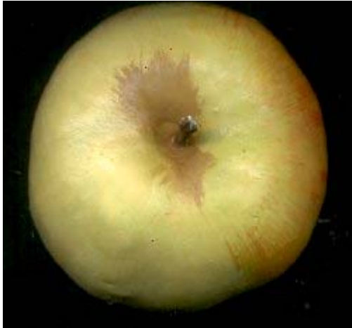
Fruit moulé de jean-louis choisel .1986©.